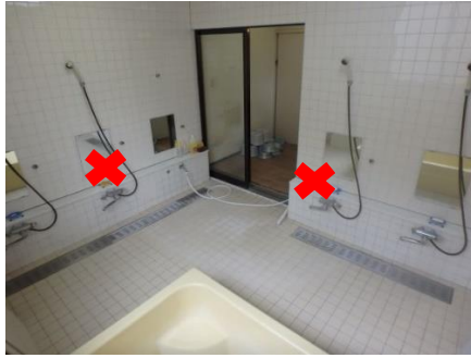
男子：利用可能シャワー2か所