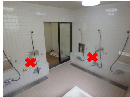
女子：利用可能シャワー3か所